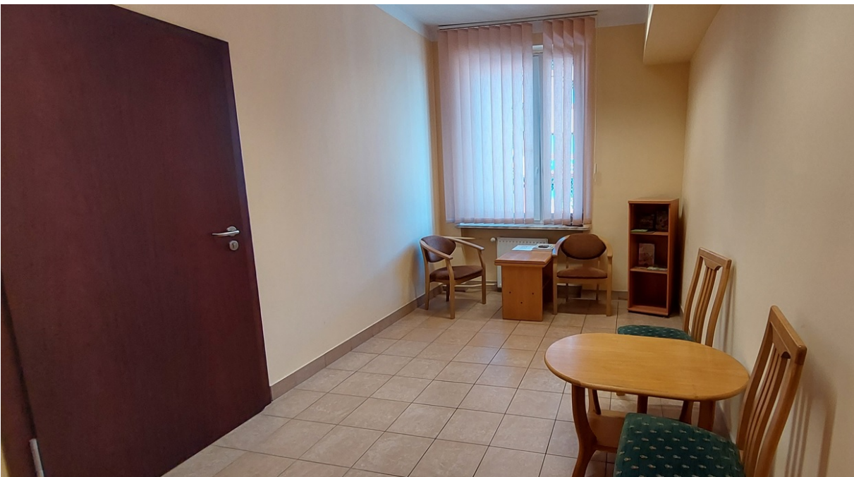
Poczekalnia Pokoju Przesłuchań